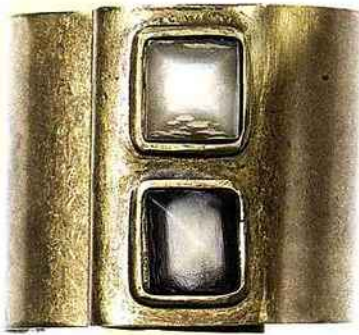
Antique Manchette en métal doré. Marni, 187 euros.