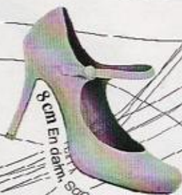
8 cm En dentelle San Marina, 79 €