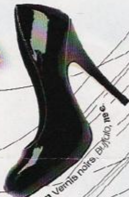
11 cm Vernis noirs Buffalo, 79 €