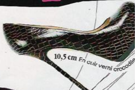
10,5 cm En cuir verni crocodile